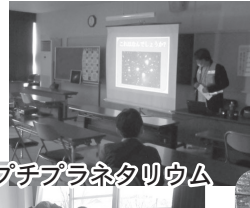
プチプラネタリウム