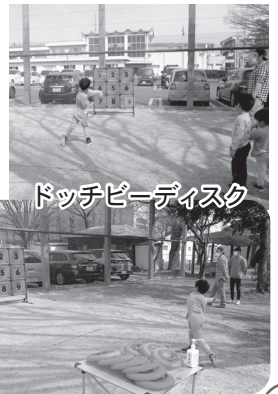
ドッチビーディスク