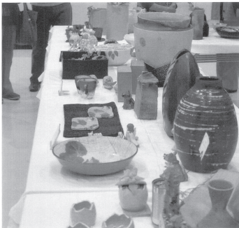
作品の展示とバザー 会場：大泉町公民館1階ホール 日時：令和5年10月28日(土)13:00~17:00 29日(日)10:00~16:00