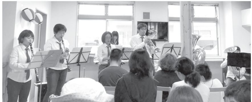
社会福祉法人 は一とわーくでの演奏