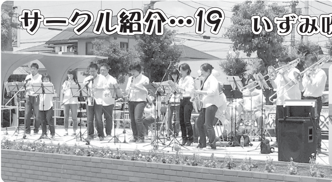
活きな世界のグルメ横丁での演奏