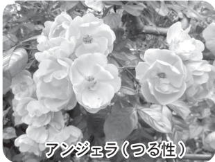
アンジエラ(つる性)