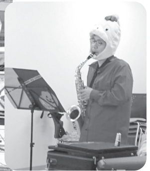
本番前の練習 (ハロウィン仕様)