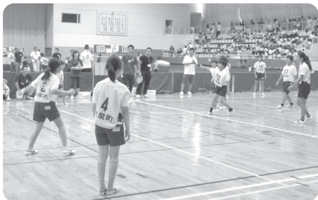
6月：ドッチビー大会