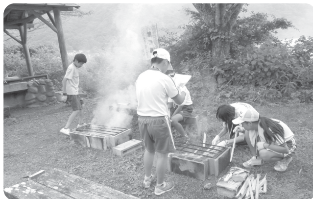
8月：リーダー教育キャンプ