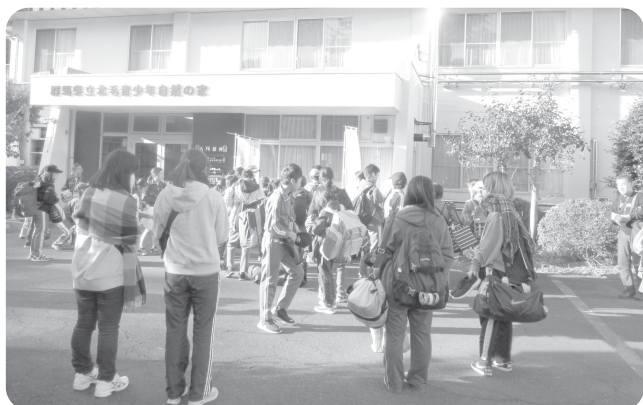
11月：ジュニアリーダー養成研修