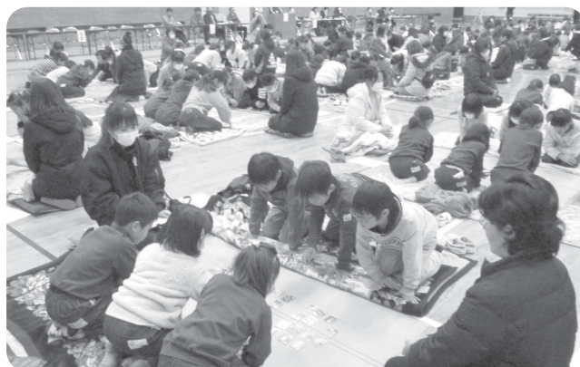
1月：上毛かるた大会

※新型コロナウイルスの影響により、サークル紹介の順番を変更してお届けしております。