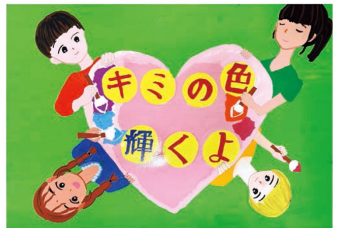
●北中学校1年● 金井 乃按