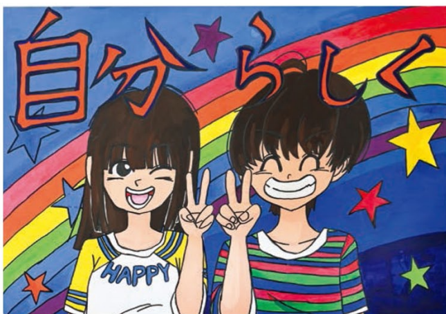
●西小学校6年● 亀井 芽依