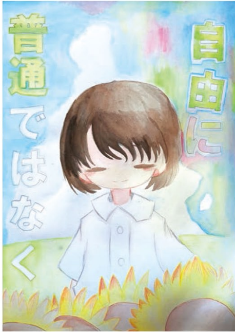
●北小学校6年● 荒井 萌衣