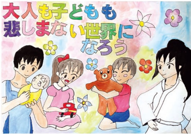
●西小学校4年● 大関 里亜