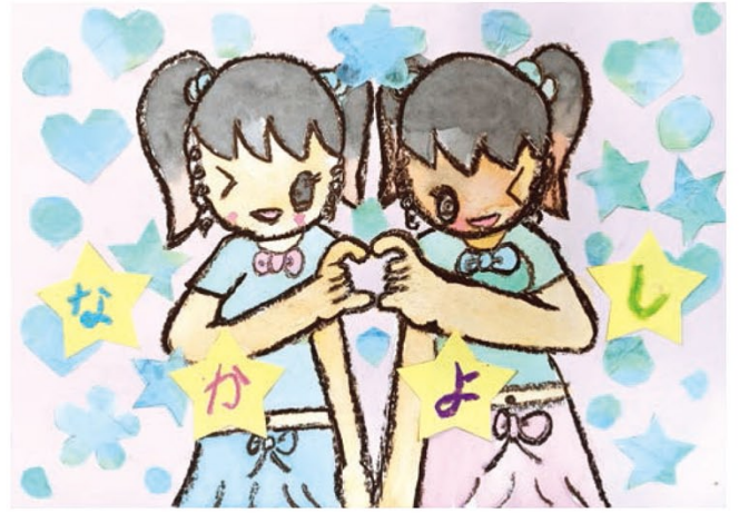
●東小学校2年● オカダ ルビー