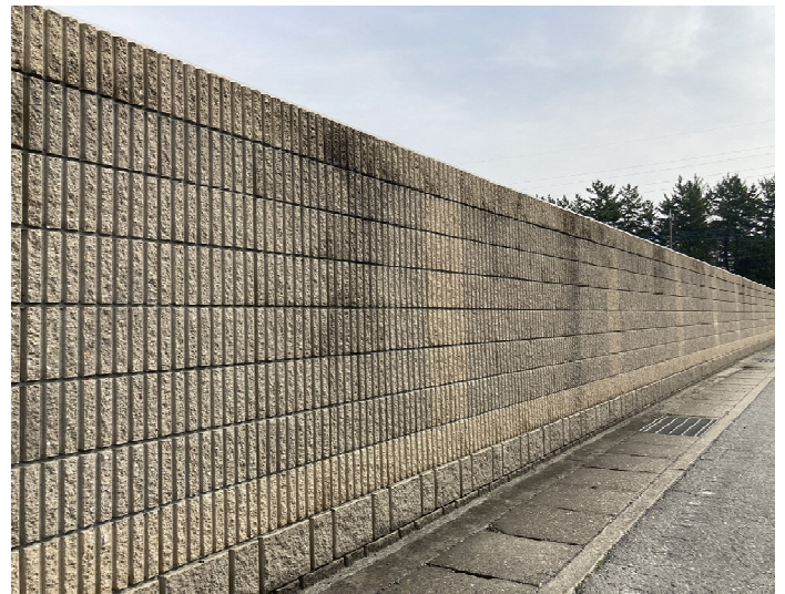
このように化粧された塀もブロック塀です