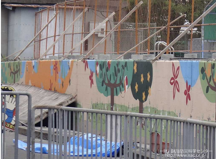
H30.6大阪府北部地震により小学校の ブロック塀が倒壊（小学生が亡くなる）