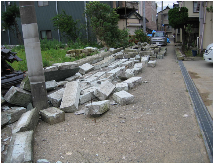
地震により石塀が倒壊（道路をふさぐ）