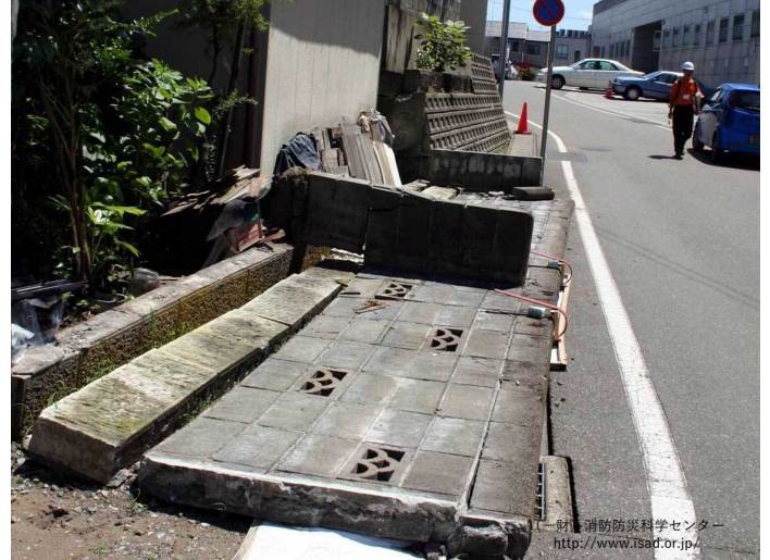
地震によりブロック塀が倒壊