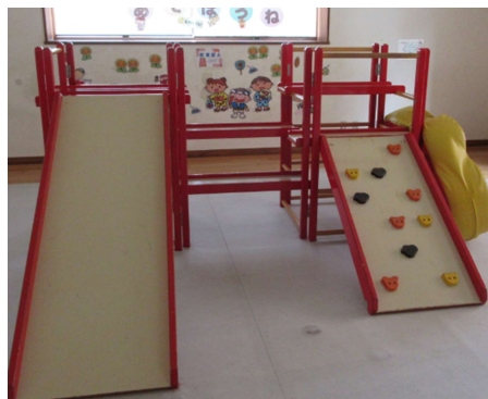
NO. 2 幼児用滑り台