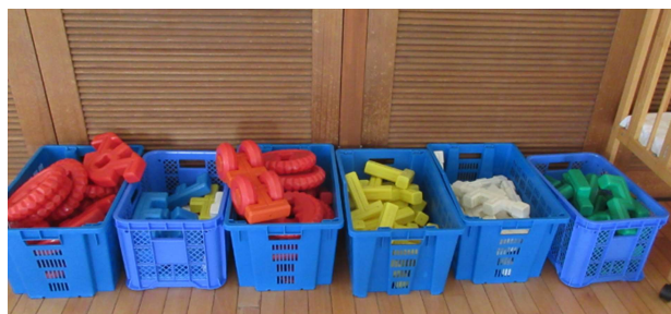
NO. 3 幼児用ブロック