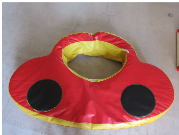
NO. 7 幼児用クッション