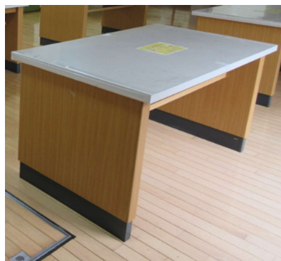
NO. 1 作業台