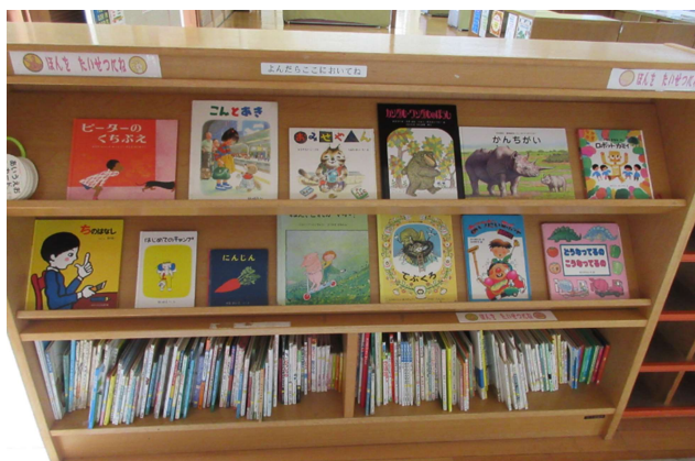
NO. 5 本棚