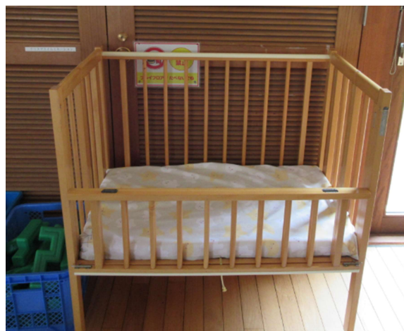
NO. 6 ベビーベット