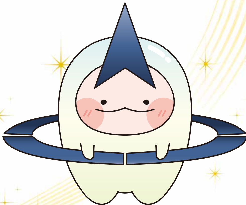
大泉町マスコットキャラクター 「イズミオ〜」