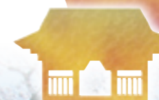
北中横の西の丸跡▶ 小泉城址 (城之内公園)▼

1489年に富岡主税介直光が築城したと伝わり、以降富岡氏6代の居城となっていた小泉城。囲郭式の平城だった本丸跡は、現在は城之内公園となり、本丸を囲んでいたお堀や西北の塁構が昔の面影を今に伝えます。