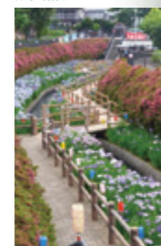
いずみ緑道▶ 分水堀緑道▼

大泉町はとても緑豊かな町です。ツツジやハナショウブが美しい分水堀緑道、桜の城之内公園、さまざまな樹木が茂るいずみ緑道、雄大な流れの利根川までのグリーンロードを歩けば、心も体も緑に染まります。