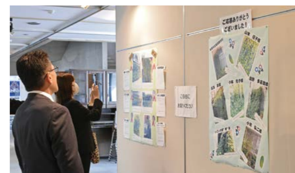
▲緑のカーテンコンテストの写真展示

産業フェスティバルでは、たまごつかみ取りゲームやステージパフォーマンスなどが催され、会場は多くの人でにぎわい、各テナントにも長蛇の列ができていました。また、会員事業所のPR展示会ではそれぞれ事業所の特色を出した展示物などがあり、来場していた人は興味深く見学していました。