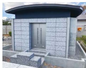
■大泉町公園墓地合葬墓