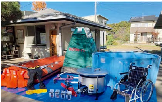
■大泉町第17区防災会

町では、災害時に備え、町内全域で28の自主防災会が組織されています。「大泉町第17区防災会」は（一財）自治総合センターが実施する宝くじの収益金による助成事業で、救助ボート・組立水槽・簡易トイレなどを購入、整備しました。皆さんのご家庭や職場でも、非常用持ち出し品の準備や避難場所の確認について話し合うなど、突然やってくる災害に備えてください。 ※詳しくは、安全安心課危機管理係（内線841）へ。