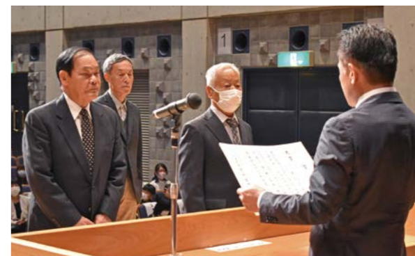
▲SDOizumiごみステーションコンテスト2023表彰式

環境フェアでは「この素晴らしい自然環境を次世代に残そう」をテーマにごみの減量化や資源化、地球温暖化対策に関する取り組みを紹介し、来場者は環境の大切さを改めて学んでいました。また、大ホールで「ポイ捨て防止ポスターコンテスト」、「SDOizumi ごみステーションコンテスト2023」、「緑のカーテンコンテスト」の表彰式も行われました。