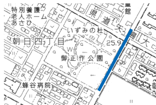
■朝日三丁目・四丁目地区