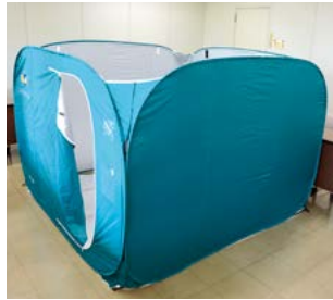
■整備するパーティション