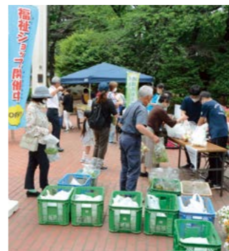
福祉ショップの様子