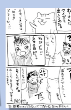
PN むったんのおかん。