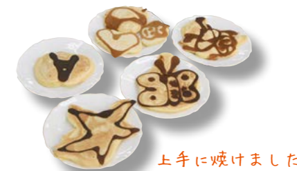
上手に焼けました

2月17日、町公民館実習室で「お絵かきパンケーキで野菜サンドを作ろう！」が開催されました。この講座は、男性の家庭参画を推進する目的で実施されており、たくさんのお父さんも参加しました。パンケーキのお絵かきを可能にする秘密は、生地を焦げ。砂糖（はちみつ）とタンパク質（卵・牛乳）を加熱するとメラノイジン（焦げ）が発生するメイラード反応を利用したもので、加熱されたプレートの上に初めにはちみつ入りの生地でお絵かきをした後、普通の生地を流し込むことにより焦げの模様ができる仕組み。お絵かきパンケーキが焼き上がった後は、ハムや野菜をサンドしてできあがり！ 参加した皆さんは、食の大切さと料理の楽しさを科学を通して学びました。