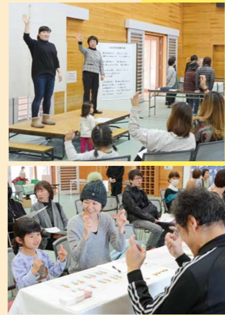
▲手話体験イベント

町では、大泉町手話言語条例を制定するなど、町民一人ひとりが聴覚などの障害について正しく理解し、誰もが暮らしやすい環境づくりを進めています。