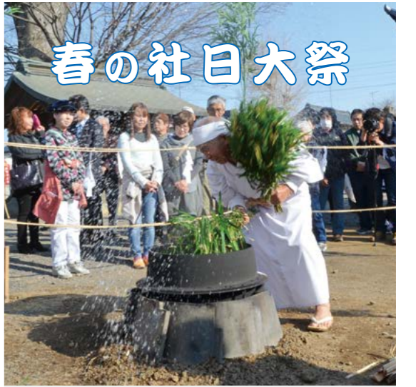
活きな世界のグルメ横丁