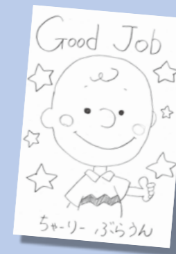
PN チャーリーぶらうん