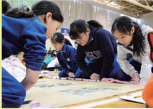
町発足60周年記念事業「大泉町子ども会上毛かるた大会」