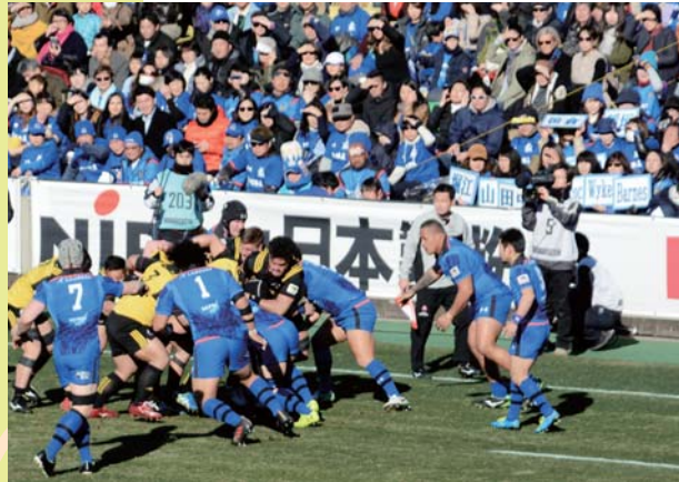
第55回日本選手権大会決勝

1月7日、町民体育館を会場に「町発足60周年記念事業平成29年度大泉町子ども会上毛かるた大会」が行われました。会場には、各地区の代表458人が集まり、今までの練習の成果を発揮すべく、優勝を目指して熱い戦いが繰り広げられました。