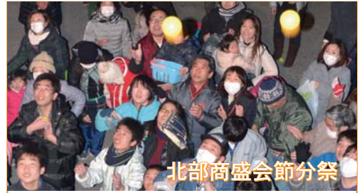
北部商盛会節分祭

毎年2月1日から28日までの1か月は「省エネルギー月間」です。 □省エネ対策 ・冬の室温は20度以下を目安にし(あしや) ・見ないテレビや照明は消し(まじや)