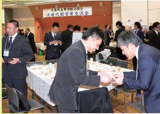
企業情報交換会「次世代経営者交流会」