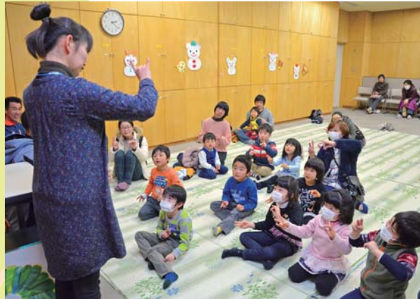
子どもお楽しみ会

2月1日、文化むらで次世代を担う若手経営者や後継者などの交流を目的に、大泉町企業情報交換会「次世代経営者交流会」が開催され、町内外から97社、112人が参加しました。今回は労働法の基礎知識について学んだあと、情報交換会で企業同士の交流が盛んに行われました。