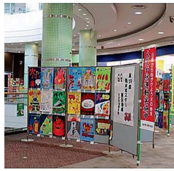
【防火ポスター展示会】

□注意点 ・年金を受給するための年齢要件に変更はありません ・遺族年金や障害年金の受給権がある場合、手続きをしても受け取る年金額が変わらないケースがあります ・遺族厚生年金の受給要件は