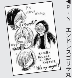
▲ P・N エンドレスゴリラ丸