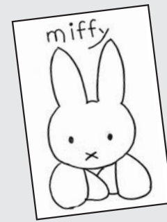
▲ P・N ミッフィー