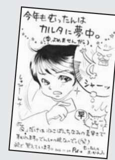
▲ P・N むったんのおかん