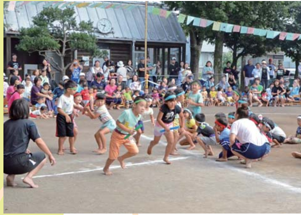
町立保育園運動会