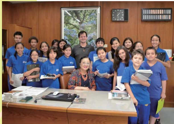
ジェンテ・ミウダ校役場見学

10月2日、町内3つの町立保育園で運動会が開催されました。雨で1日順延となりましたが、子どもたちは、競技や演技などで、元気よく日ごろの練習の成果を発揮しました。また、応援席のお父さん、お母さん、おじいちゃんやおばあちゃんからは、大きな拍手と大声援が送られていました。