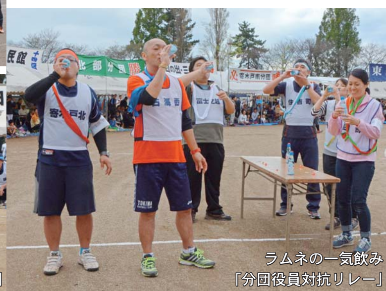
ラムネの一気に飲み 「分団役員対抗リレー」