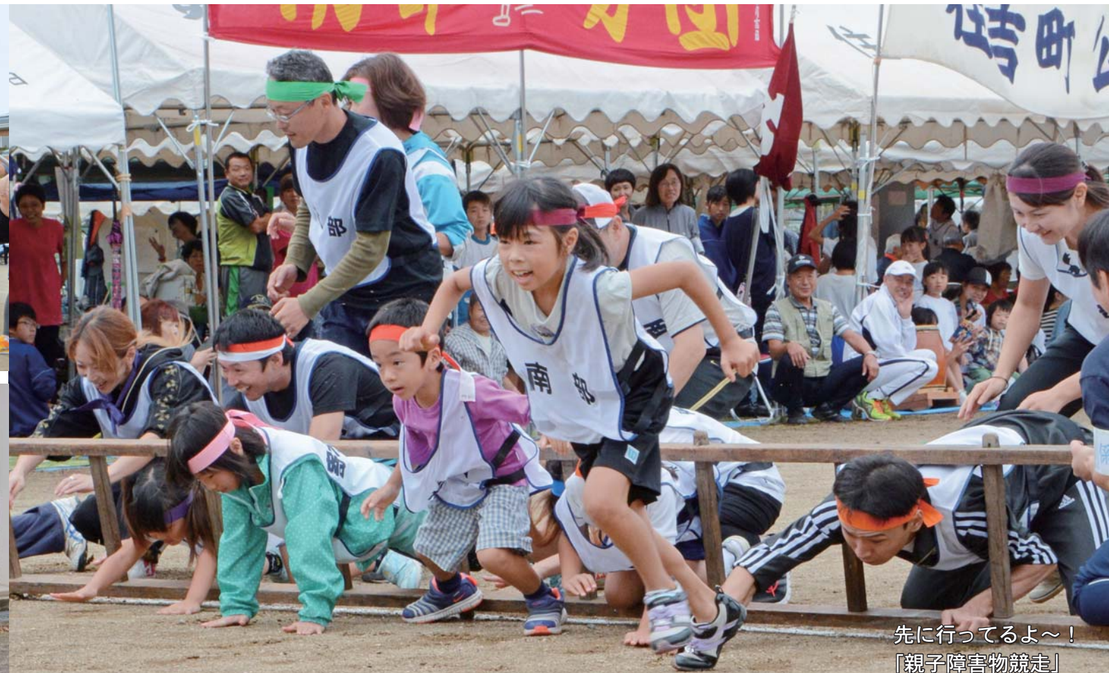
先に行ってるよ～！ 「親子障害物競走」