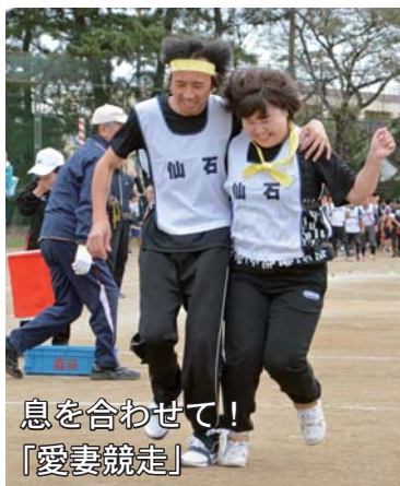
息を合わせて！ 「愛妻競走」