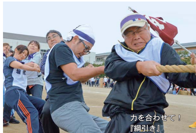
力を合わせて！ 「綱引き」