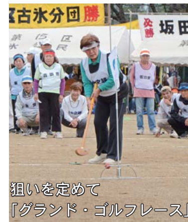
狙いを定めて 「グランド・ゴルフレース」