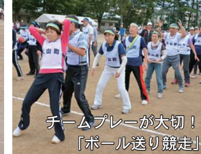
チームプレーが大切！ 「ボール送り競走」