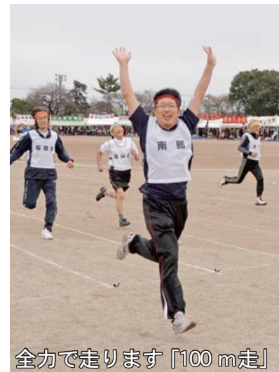
全力で走ります「100 m走」