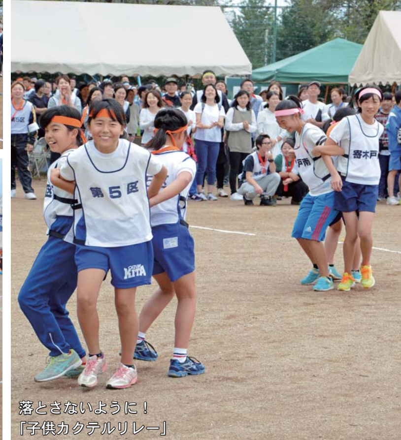
落とさないように！ 「子供カクテルリレー」