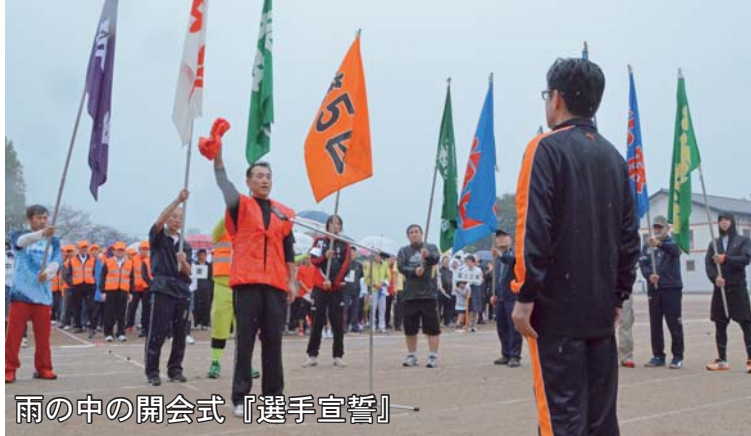
雨の中の開会式「選手宣誓」