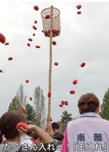
たくさん入れー！「玉入れ」

10月9日（日） 天気： のち 南中学校校庭を会場に第60回大泉町民体育祭が開催されました。 午前中はあいにくの雨となりましたが、各分団は優勝を目指して、 熱戦を繰り広げ、南部分団が見事優勝を勝ち取りました。