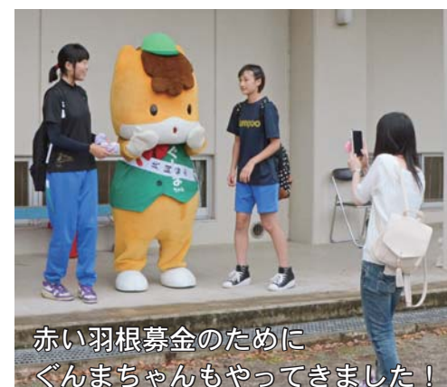
赤い羽根募金のために ぐんまちゃんもやってきました！