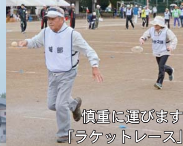
慎重に運びます 「ラケットレース」