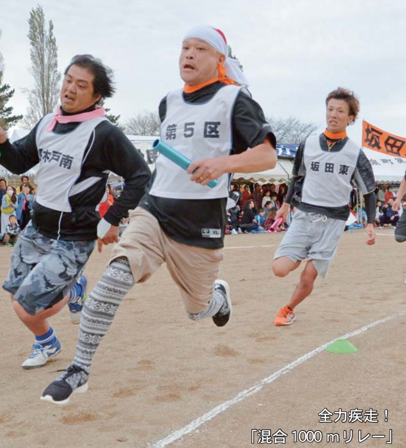
全力疾走！ 「混合 1000 mリレー」