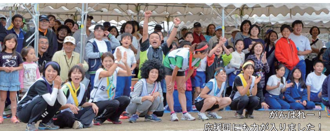
がんばれー！ 応援団にも力が入りました！