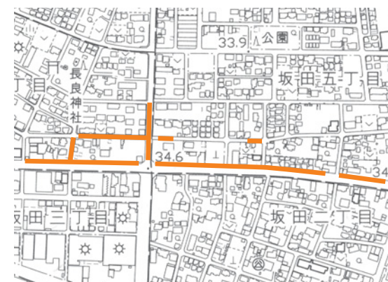
■坂田四丁目、五丁目地内

【吉田地内】 □工事期間 10月中旬予定 定く平成28年2月15日(月) □交通規制 全面通行止め