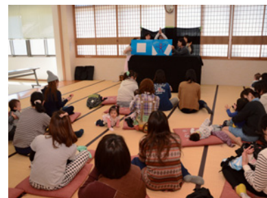
健やか広場の様子