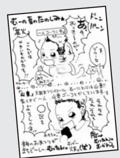
▲P・N むったんのおかん