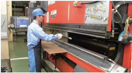
▲板金の曲げ加工を行う様子

さまざまな企業が立地している大泉町。このコーナーでは各企業の担当者に登場してもらい、会社の概要や業務内容などについて、お話を伺います。