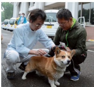
春の狂犬病予防注射の様子

※館林地区獣医師会所属の動物病院でも、登録と狂犬病予防注射を毎年1月までの期間随時行っています。なお、動物病院によって料金などが異なることがあります。