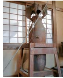
不発弾（文化むら展示の様子）