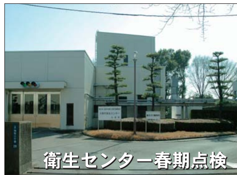
衛生センター春期点検

衛生センターでは、施設保全のための春期点検を実施します。 次の期間はし尿・浄化槽汚での受け入れができませんので、お早めのお取りや清掃をお願いします。ご理解とご協力をお願いします。 □受け入れできない期間 4月6日(月)、7日(火)、8日(水) ※詳しくは、環境課(内線132)へ。