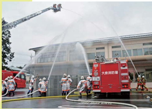
大泉町模擬火災訓練