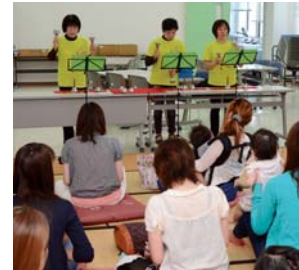
6月に行われた健やか広場の様子