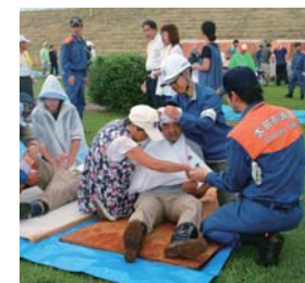
自主防災組織の皆さんも参加した防災訓練の様子

「自分たちの住む地域は、自分たちで守る」、これが地域を守る最も効果的な方法です。震災のような広域災害では、救出活動も消火活動も、早く始めるほど、そして多くの人が協力するほど、被害を抑えられます。 阪神・淡路大震災では、救出された人たちの約8割が、家族や近所の人たちにより救出されました。