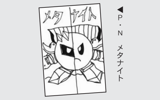
▲ P・N メタナイト