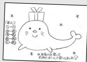
▲ P・N アシタ