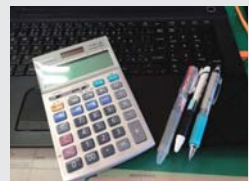
申告相談まであと少し

また今回申告対象の平成25年分の所得税から、復興支援所得税の創設、平成26年度分の住民税から復興支援のための均等割の増額。そして4月からは消費税アップと税金の増額が目立ちます。震災からの早期復興と社会保障費の財源といったように用途は明確ですが、増税となれば問い合わせも増えます。申告相談開始まであと少しですが、住民の皆様の質問、疑問に答えられるよう改正点の最終チェックをしています。