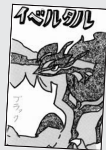
▲ P・N ブラック