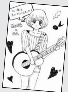
▲ P・N いし