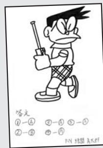
▲ P・N 緑間 真太郎