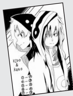
▲ P・N 咲夜