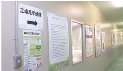
▲見学用の通路が用意されています

さまざまな企業が立地している大泉町。このコーナーでは各企業の担当者に登場してもらい、会社の概要や業務内容などについて、お話を伺います。