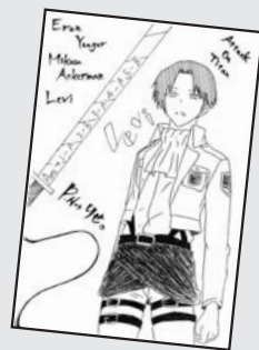
▲ P・N りせ。