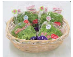
▲工場で作成・販売している製品

会社の概要：株式会社大泉野菜工房の敷地の一部を利用して、2010年に設立。現在、従業員数は2人、敷地面積は840㎡。「あんしんレタスで笑顔の食卓」をキャッチフレーズとし、温度・湿度・養液濃度・照明時間などを管理した完全閉鎖型植物工場ではレタスを栽培しています。外から遮断された密閉空間なので、害虫の侵入がないなどの理由で無農薬栽培ができ、天候に左右されないため、一年を通して安定供給が可能となっています。