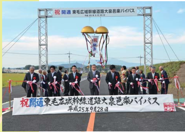
国道 354 号バイパス開通式