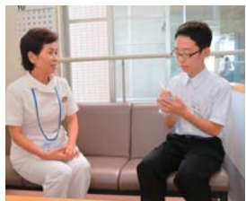
看護師長さんにも話を聞きます

す。医師になるためにはいろいろなことが必要ですが、4人ならさまざまなことを学び、夢をかなえられと感じました。