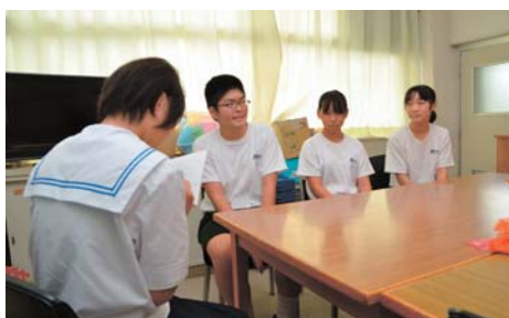
同級生にインタビュー

「もといっしょに学ぶ楽しさを感じました。」「いいところをたくさん学びたいと思います」 3人は、すごく真剣に働いていて、輝いていました。