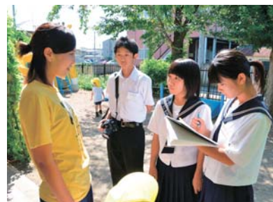
みんなで取材をします

先生たちにも、職場のことについて聞きました。まず最初に4人の職場体験の様子を聞いてみました。「一生懸命がんばって