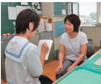
メモをしっかりとります

■ 職場体験 私は9月10日から12日までの3日間、大泉町役場の広報情報課で職場体験を行いました。私は、この3日間で仕事の大変さ、楽しさ、やりがいを感じました。 ■ 生徒にインタビュー 私は、町立西小学校に行き、そこで職場体験学習をしている3人の生徒にインタビューをしました。 問 「この職業を選んだ理由は？」 答 「昔から人に物事を教えることが、好きだからです。」「ある先生に憧れていたからです。」「人に何かを教えたいと思ったからです」 問 「この職場体験で感じたことは？」 答 「クラスをまとめたりするのは大変だなと思いました。」「大変さと、子ども