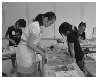
町ファミリー・サポート・センターの活動の一例(夏季絵画教室)

町ファミリー・サポート・センター講習会 町ファミリー・サポート・センターの「まかせて会員」に登録され、活動できます。 ○期日 下表をご覧ください ○場所 町公民館南別館(吉田2011の1) ○定員 20人(定員になりしだい締め切り) ○申込方法 町ファミリー・サポート・センターへ直接、または電話・FAX(55・8373)、メール(intoo@oizumi-fsc.jp)へ申し込む ※昼食は各自で用意ください。詳しくは町ファミリー・サポート・センター(☎55・8373)へ。 町ファミリー・サポート・センターへ