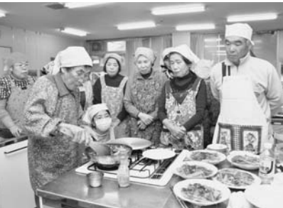
昨年の料理講習会の様子

町生活研究グループ連絡協議会は、自家製農産物を利用した伝統料理の技術をもつ農家の主婦が中心となって活動している女性グループです。いっしょに活動するグループ員を募集します。 □活動内容 花ずし講習会、伝統料理講習会、米消費拡大事業、他市町村グループ