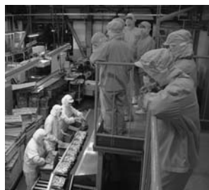
町が実施した「施設めぐり」の工場見学の様子