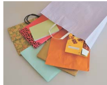
その他の紙を紙袋に入れます

□出し方 資源ごみの収集日に、次のいずれかの方法で出してください ・その他の紙の大きさを揃えて、ひもなどで十文字