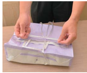
ひもでしばりましょう

にしぼる ・その他の紙を、雑誌と雑誌の間に挟んでひもで束ねる ・その他の紙を、紙袋に入れてひもでしばる