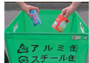
食品品の缶も「緑色の収集袋」に入れてください

の変更点 アルミ缶・スチール缶の分別品目は、飲み物の缶のみでしたが、食品品の缶（缶づめの缶や、ミルク缶など）を資源ごみとして追加しました。