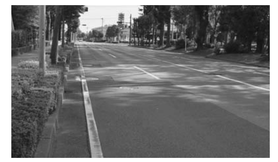
いつもきれいな道路を目指して

町では、住みよい環境を地域でつくる運動の一環として、町民総参加でご協力をいただいている「秋の道路愛護運動」の実施期間が決まりました。 実施日は行政区ごとに決められますが、作業の重点に留意され、ご協力をお願いします。 □実施期間 9月22日（日）～29日（日） □主な作業 ・道路の清掃 ・道路端や植樹帯などの除草・ごみ拾い ・道路にはみ出た樹木の伐採 ※道路上には物を置かず、道路を広く使えるようにしましょう。詳しくは、土木課（内線203）へ。