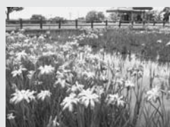
あやめ祭りの様子

7月末にはいよいよ大泉まつりですね。この原稿が広報に掲載される頃、大泉町では祭りの練習に打ち込む音が夜風に乘っているのでしょうか。