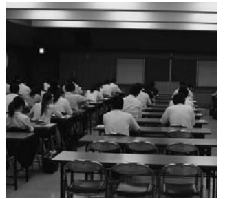
昨年の職員採用試験の様子