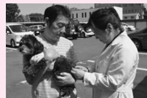
役場での狂犬病予防注射の様子

□ 犬はつないで飼う 放し飼いは近所の迷惑になるだけでなく、人にかみつくというような事件に発展する可能性もあります。そういった事件を起こさないためにも、放し飼いやリードなしでの散歩はやめましょう