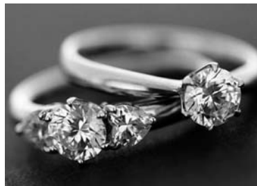
貴金属などの訪問購入は飛び込み勧誘が禁止となりました