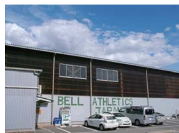
棒高跳び専用の室内練習場「ベルアスレチックスジャパン」

練習は、毎週末、吉岡町のベルアスレチックスジャパンという施設で行う。こは、小学生から高校生、社会人も通う全国でも珍しい棒高跳び専用の室内練習場だ。