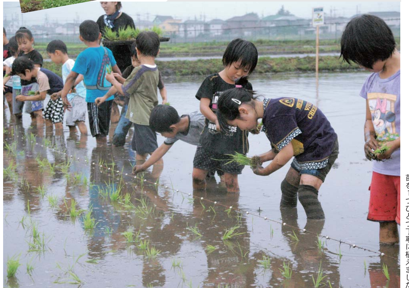
苗を一つひとつ丁寧に植えました

6月10日・12日・14日の3日間、上小泉地内の田んぼなどで、町立保育園児による田植え体験が行われました。年少さんが見守る中、子どもたちは、慣れない田んぼの中で足をとられて転びそうになりながらも、一生懸命に苗を植えていました。田植えの後には、待ちに待った泥遊び！園児たちは、泥だらけになって広い田んぼ中を駆け回り、みんなで楽しそうにはしゃいでいました。