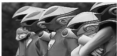
G-FIVEといっしょに学ぼう！

就学前家庭教育学級 公開講座 町公民館内学級事務室 □ 期日 8月1日（木） □ 時間 午前10時～正午 □ 場所 文化むら展示ホール（朝日5の24の1） □ 内容 G-FIVEの学び！めざせ安全！園児たち □ 講師 県警職員、NPO法人グレート群馬ネットワーク（G-FIVE） □ 対象 就学前の子どもと親 □ 申込方法 町公民館内学級事務室へ電話、またはEメール（gakujinushitsu@ostsannet.ne.jp）のタイトルに講座名、本文に氏名・住所・電話番号・託児の有無を入力して申し込む □ 申込期限 7月25日（木） □ 受講料 無料 ※託児は事前に申し込みが必要となります。詳しくは、町公民館内学級事務室（☎62・2542）へ。