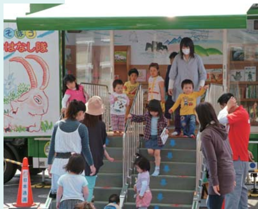
全国訪問おはなし隊

4月7日、全国訪問おはなし隊が、図書館を訪れました。参加者は、キャラバンカーの中にあるたくさんの絵本を読んだり、おはなし隊の皆さんが読む絵本や紙芝居を楽しそうに聞いたりしていました。