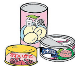
「アルミ缶・スチール缶」に追加となったものの一例

これまで、アルミ缶・スチール缶の分別品目は、飲み物の缶のみでしたが、食料品の缶（缶づめの缶や、ミルク缶など）も加えて収集します。