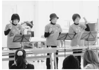
昨年12月に行われたときの様子