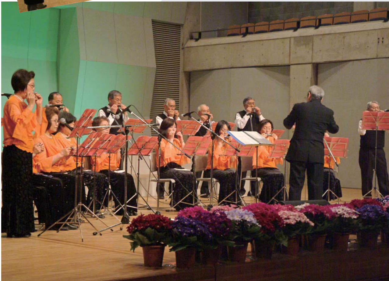
大泉ハーモニカクラブによる演奏