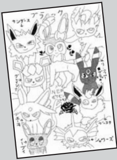
◀ P・N ブラック