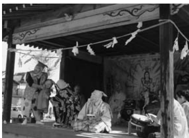
昨年の御神楽の様子