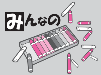
イラストは黒で描いてね!