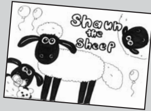
◀ P・N ショーン