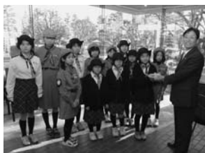
今年1月、集めた募金を寄附する様子