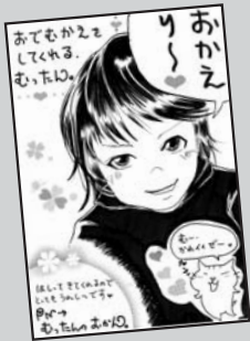
◀ P・N むったんのおかん