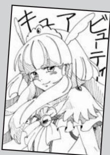
◀ P・N あまあし