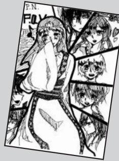
◀ P・N F・O・V