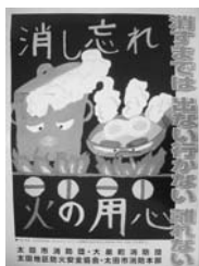
平成23年度最優秀作品