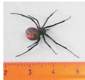
セアカゴケグモ（メス）