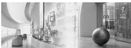
印刷博物館（館内と入り口） ※印刷博物館ホームページより引用