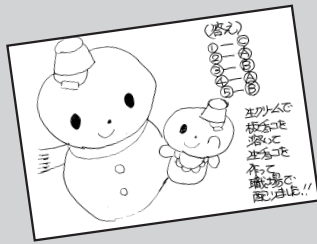
◀ P・N 雪タルマ