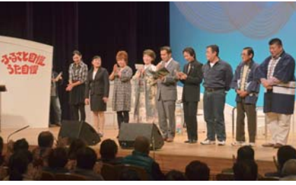
文化むらで行われた公開録音は大いに盛り上がりました

昨年11月2日に文化むらにおいて、町発足55周年記念事業として公開録音が行われた、NHKラジオ第1「ふるさと自慢った自慢」が、「ふるさと自慢った自慢」および「ふるさと自慢コンサート」として放送されます。