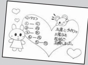
▲ P・N ハート