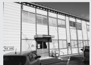
地震の影響で仮設庁舎で業務を行っている須賀川税務署

しても、以前大泉町で課税を担当していたころと比べ受給世代がシフトしているなど作業をしながら時の流れを実感しています。そういえば恒久的な減税とされていた定率減税もいつの間になくなっていきますね。そして、ほどなくすると7年間のブランク、震災関係の雑損控除適用2年目などといった不安要素を抱えながら確定申告の受付に臨むことになります。