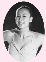
トークゲスト 浅田 舞さん

アイスショーなどに出演するほか、スポーツキャスターとしてテレビ、新聞などで活躍しているプロスケーターの浅田 舞さんをお迎えし、楽しいお話と名曲の数々をたっぷりとお楽しみいただきます。