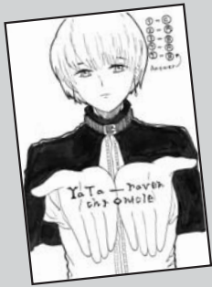
▲ P・N b p m D A