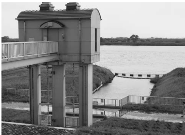
豊かな水を未来へ（2市5町 県水取水口）

東部地域水道用水供給事業を含め、5か所の供給事業があります。その中で、私たちの利用する「水道用水供給事業」が、受水単価が一番高く、加えて、上水道の給水口が下水道の配水口の下流にあるため、常時活性炭を利用している現状があります。この点について、町長はどのように考えていますか。