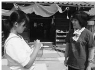
しっかりメモを取ります