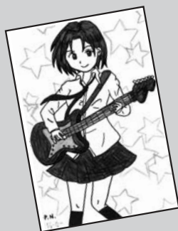
◀ P・N ジョーカー