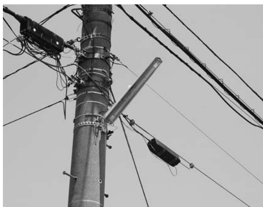
一日も早い防犯灯のLED化を

CO 2 削減による地球温暖化防止に貢献し、更に電気料金の節約などを考え合わせると、できれば地元企業P社と連携し、町の庁舎、駐車場、教育施設などを利用しての太陽光発電の導入、また、公共施設内の照明のLED化、町が補助し、区が管理している防犯灯のLED化を早急に行うべきと考えますが、町長はどう考えていますか。