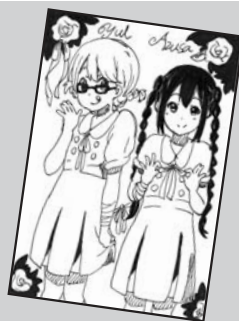
◀ P・N K