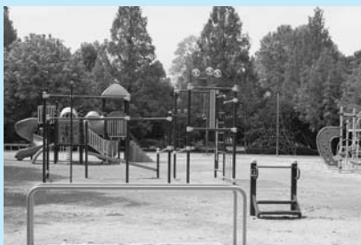
新しくなった公園遊具