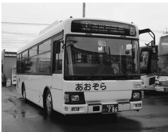
広域公共バス「あおぞら」

A 太田記念病院への乗り入れの提案が主な議案であり、他の提案はない状況でした。新しい町を含めたルートをつくる場合は、新組織の会議が必要になります。