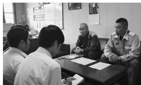
いろいろなお話を伺いました

私たちは消防署に取材に行つて、資機材や車両をそろえるには多くのお金が必要だということが分かりました。また、人の命を守るためにはさまざまな工夫や努力が必要であることも分かりました。