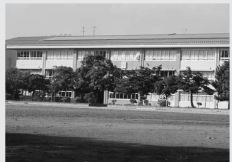
南中生の新しい学び舎