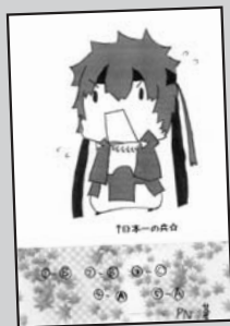
◀ P・N 蒼