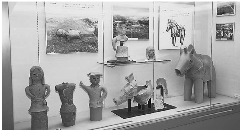
大泉町文化むら 埋蔵文化財展示室

A ページに、文化むらの埋蔵文化財展示室の紹介はありますが、修復された埋蔵文化財の紹介コーナーはありません。出土地や推定年代など、簡単な説明を付けてホームページで紹介すれば、児童生徒や歴史好