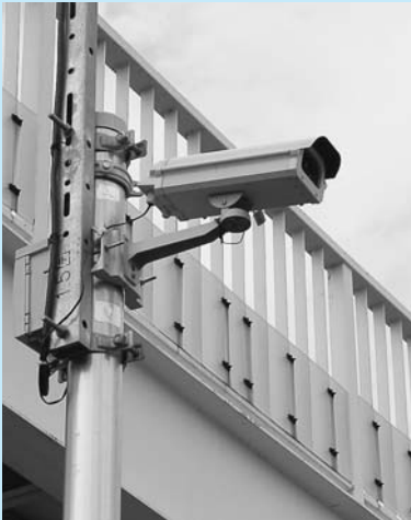
みんなを守る防犯カメラ