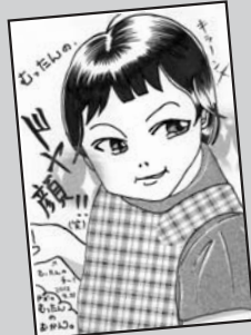
◀ P・N むったんのおかん。