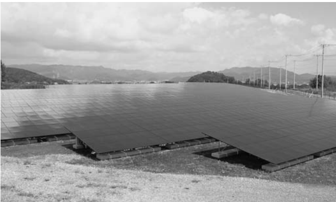
全国に設置が広がるメガソーラー

してそのような遊休地・休耕地を買収し、そこにメガソーラーを設置する。この方法で、何年間も全く無収入だった町有地、また、このままでは、今後もしばらくそうした状態が続くと思われる町有地と引き替えに、安定した収益を産む、価値のある町有地を確保できます。町長はどのように考えますか。