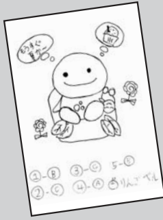
◀ P・N りんこベル