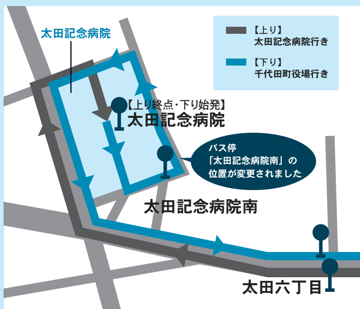
■太田記念病院周辺路線図