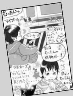
◀ P・N むったんのおかん