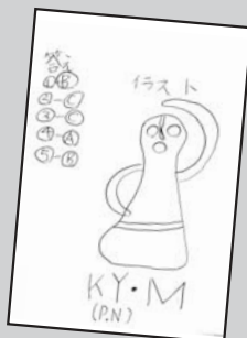
◀ P・N KY・M