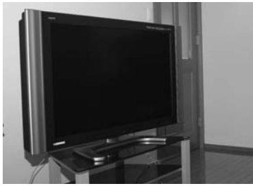
地震対策はお済みですか