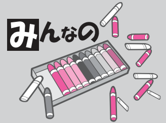
イラストは黒で描いてね!