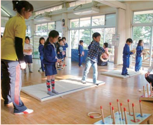
あそぼう元気に児童館

4月19日、西児童館で「あそぼう元気に児童館」が行われました。子どもたちは児童館の約束ごとを教わった後、輪投げやヨーヨー釣りをしたり、わたあめを頬張ったりと、思い思いに楽しんでいました。