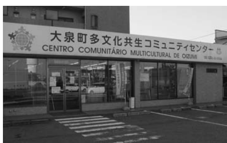
多文化共生のための情報発信拠点

答： 少し古くなりますが、就学状況について調査したことがあります。教育は、国にとっても子どもにとっても重要なことです。外国人集住都市会議の一員として、教育問題に関しても国に対して継続的に要請を続け、町としてできることがあれば検討していきたいと思えます。