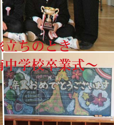
表紙…旅立ちのとき ～南中学校卒業式～