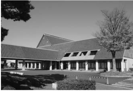
文化の拠点でもある文化むら

今回も、より良い町づくりのために多くのご意見・ご要望をいただくことができました。その内容の一部をご紹介します。