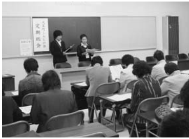
過去に行われた講座の様子