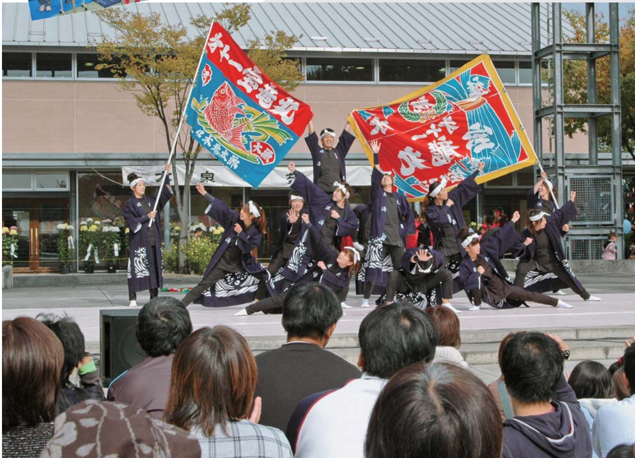
屋外ステージで披露された、波濤によるよさこいソーラン

10月30日、御正作公園・いずみの杜で、「第15回産業フェスティバル」と「秋のいずみの杜まつり2011」が開催されました。町内業者などによる展示・即売が行われた産業フェスティバルでは、多くの家族連れがランチや軽食を楽しみ、屋外ステージ・熱気球などの催しが、会場を大いに盛り上げました。また、いずみの杜まつりでは、鉄道模型の展示や模擬店が行われ、終日にぎわっていました。