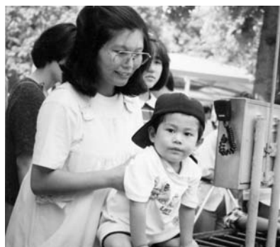
2歳の頃動物園に行ったとき