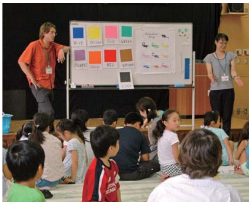
子ども夏休み講座

7月26日・27日の2日間にわたり、図書館で、子ども夏休み講座「英語であそぼ」が行われました。参加した子どもたちは、町内小学校の英語の先生と、歌やビンゴゲームなどを行い、英語であそびました。