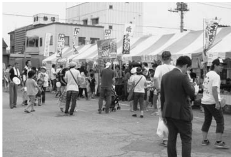
25店舗が並んだ会場には、多くの家族連れが訪れました

会場はB級グルメを買い求める大勢の家族連れなどで終日にぎわい、お客さんたちの投票の結果、県立大泉高等学校の「いもち」が最も票を集め、見事グランプリを獲得しました。