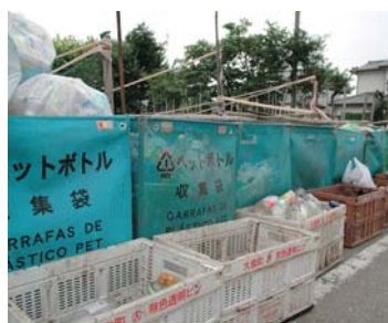
分別される資源ごみ

答：資源ごみを収集しリサイクルをするには、均一の原料でなければリサイクルは難しいようです。プラスチック製容器の場合、細かく分別して出しても、均一の種類でなければ、助燃材として燃やされることとなります。町では、素材を生かすリサイクルをするため、分別品目を限定していることをご理解願いたいと思います。