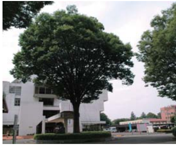
町のシンボルけやき

答：けやきは町のシンボルでもあり、人間も自然の中のひとつでありますから、やたら切ることは避けたいですが、交通の障害などになるようであれば剪定したいと思いません。また、植物は、二酸化炭素の削減にも貢献するので、共生することを考えていきたいと思えます。