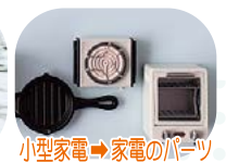
小型家電→家電のパーツ