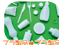
プラ製品→プラ製品