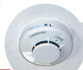
住宅用火災警報器 Fire alarms for residential properties Alarme de Incêndio Residencial

Atenção: O Alarme de Incêndio Residencial mais comum é movido a bateria. A vida útil da bateria é normalmente estimada entre 5 a 10 anos, mas tente trocar o quanto antes.