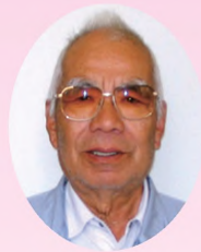
公益社団法人 大泉町シルバー人材センター