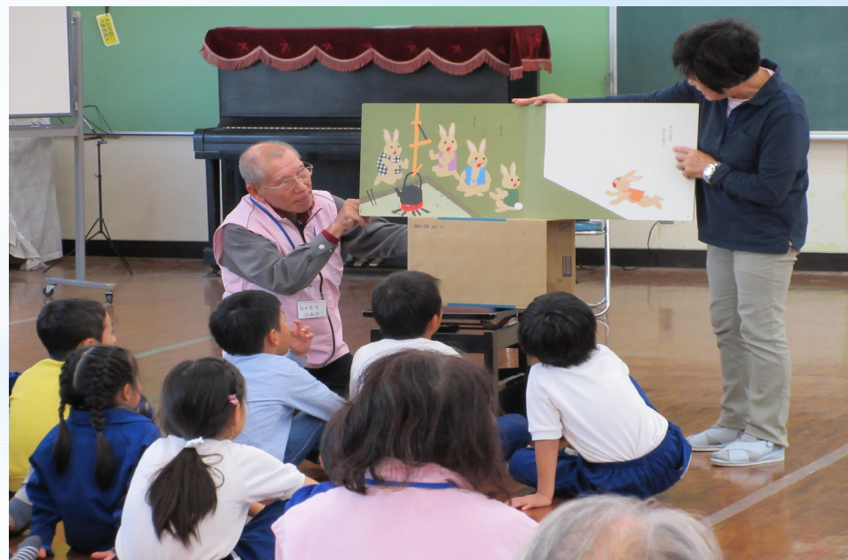
大泉町立北小学校での放課後子ども教室の様子