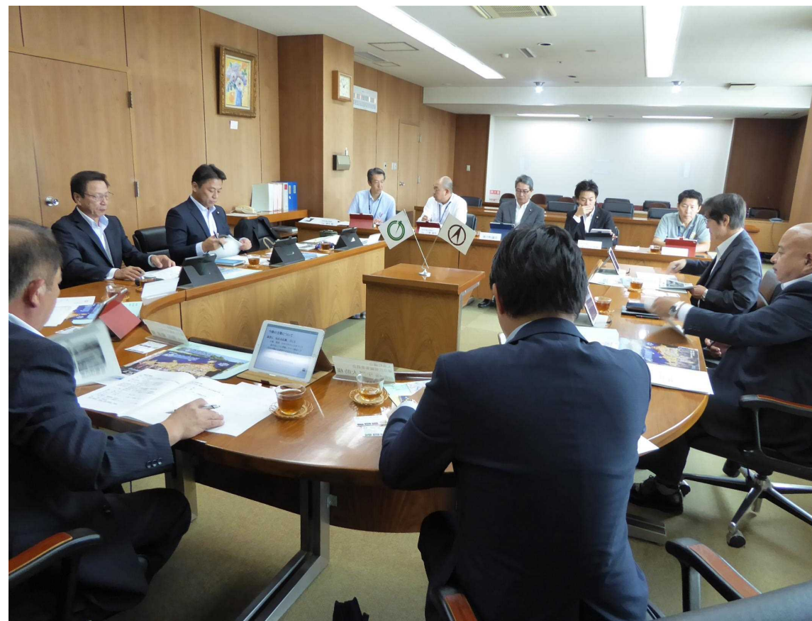
神奈川県寒川町議会広報編集委員会