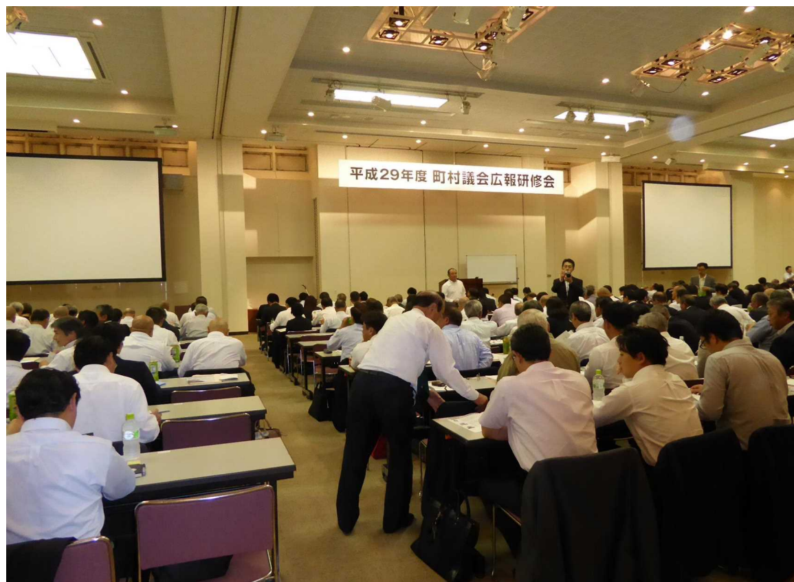
東京都千代田区砂防会館