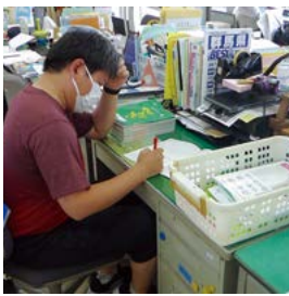
多様な業務に対応する教師

教師の多忙化は授業以外では部活動の顧問としての指導もウエイトが大きく、特に運動部活動に関しては競技経験のない教員が顧問となって指導にあたる事例もあるようです。スポーツ庁は「部活動の地域移行に関する検討会議」後、公表した提言案に休日部の活動から段階的・地域移行や運動指導に従事する教師への負担を指摘、また改革の方向性には多様なニーズに合った活動機会の充実等基本が示されましたが、どのように取り組まれるのかお聞きします。