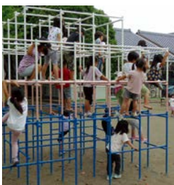
元気に遊ぶ保育園児

「町立保育園の民営化」については、とりあえず2年という形を取っておりますが、今後更なる丁寧な説明をすると同時に、子どもたちの保育・幼児保育の現場が激変しないように、少し期間を延ばす事も考えながら、皆さん方が安心して不安がないように、今後、しっかりと進めてまいります。