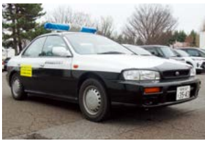
安全安心のための「青パト」

「青パト」車両の機動力拡充といった必要性では同様に考えます。本年1月青色回転灯購入とともに新たに11台の公用車を陸運支局へ追加申請し「青パト」車両は現在31台と拡充を図つたものです。また、青色防犯パトロール講習を受講し群馬県警の証明を受け、現在パトロールを実施できる職員も60名と大幅な増員となり、更に4月以降も青パトを運転できる職員及び巡回時間や回数を増やし防犯に取り組みます。