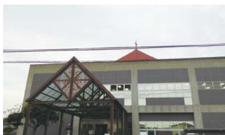
大泉町立図書館の外観