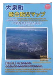
改訂前の大泉町 総合防災マップ

Q いじめ問題再調査委員会の委員構成についてお聞きします。 A いじめ問題再調査委員会は重大事態への対処時に必要に応じ、設置される機関です。委員は法律、教育、医療、心理、福祉の専門的知識及び経験を有する方で構成されています。 Q 総合防災マップの主な修正内容と配布時期についてお聞きします。 A 修正内容は警戒レベルの掲載、情報伝達手段の更新、令和元年東日本台風等の浸水箇所を更新等です。配布時期は8月を予定しています。