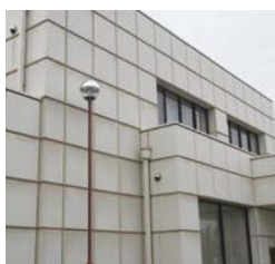
スマイル教室外観

不登校の改善対応のほか、子ども達の将来の社会的自立も視野に入れ、進路形成に資する学習支援や情報提供を行い、タブレット環境等で学習環境を広げる事も学校復帰や社会的自立へ繋がると