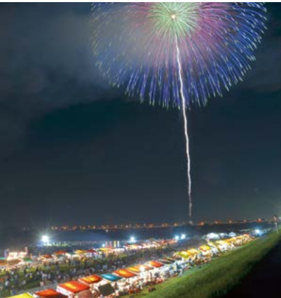
町発足60周年記念花火大会の様子

新型コロナウイルスの感染 状況や、国や県のイベント 開催に関するガイドライ ンを遵守しながら、方向性 を決めていきたいと考えて います。