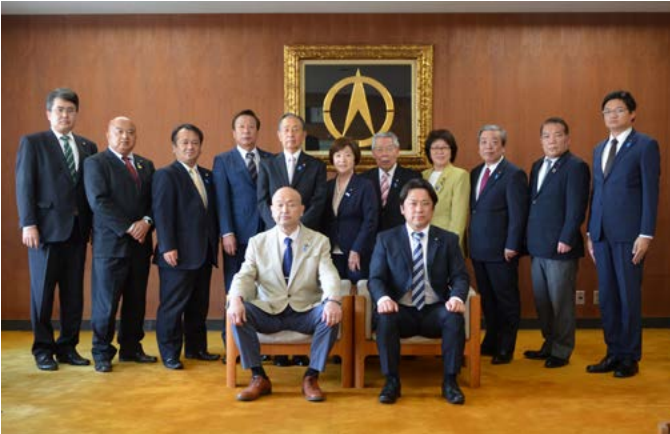
新庁舎建設特別委員会