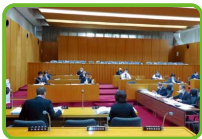
総務文教常任委員会