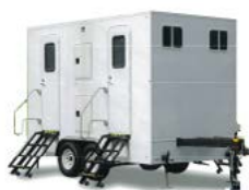
災害用トイレ トレーラー

A 個室の洋式トイレが4室あり、1200ℓと汚水タンクや洗面台等が設置してあります。