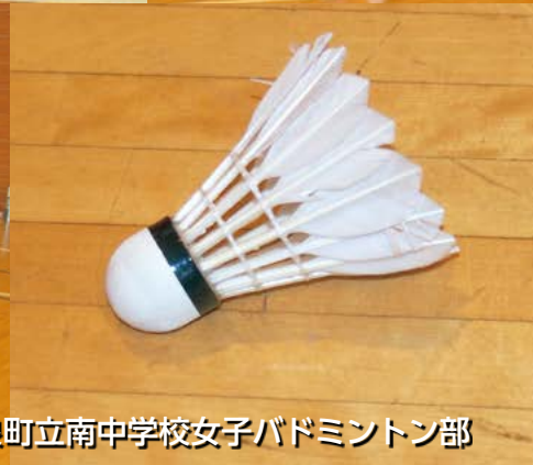
大泉町立南中学校女子バドミントン部