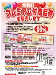
町活性化のためのプレミアム付商品券

多くの民間企業等も非常に厳しい財政状況になっております。 町は、財政調整基金や国の新型コロナウイルス感染症対応地方創生臨時交付金を活用しながら、様々な苦境に立たされている事業者を支援してきました。 プレミアム付商品券1億2千万円分を発行して、飲食店や商店等を経営されている方々にも、消費喚起や家計支援を実施しました。 今後、商工会はじめ関係機関と連携して、地域経済の向上と活性化に努めます。