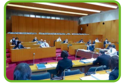
民生産業常任委員会