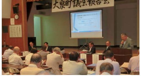
議会報告会の様子

り、大泉町公民館ホールにおいて開かれた議 し上げます。報告内容は、次のとおりです。