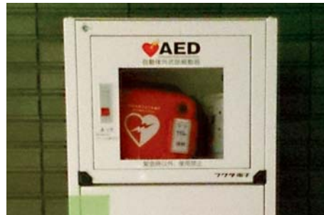
すぐに使える体制を

本町では数多くのAEDが設置されていますが、現在の小・中学校や公共施設のAEDは職員のいる時間にしか使用できない状況です。