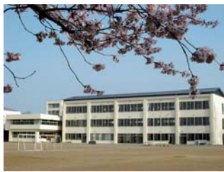
北中学校新校舎 完成

3459万円減 歳入と同様に、北中学校校舎改築事業のうち太陽光発電設置工事が平成27年度繰越事業として実施されるので校舎改築事業費を減額しました。