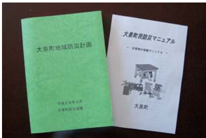
災害時の行政機能の対策を

大規模な災害が発生した際、地方公共団体は、災害応急活動および災害からの復旧・復興の主体として重要な役割を担う一方、災害時であっても継続して行わなければならない通常業務を抱えております。 全国どこでも発生する可能性のある大規模災害に対応するためには各自治体において、大規模な災害発生時であっても、業務が適切に継続できる体制をあらかじめ整えておくことが喫緊の課題であります。 このように、大規模災害に対応するためのシステムを備えておくことは、町民の安全・安心な暮らしを守る上で大変有効な手段と思