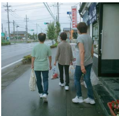
早く宅配サービスをつくってほしい

③ 「手話言語条例」の制定はろう者とその関係者の強い願いを実現するという極めて重要な意義があります。ぜひ「手話言語条例」を制定してください