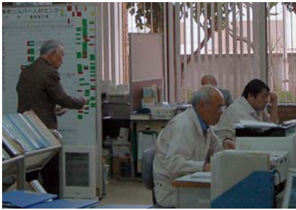
活躍が期待されるシルバー人材