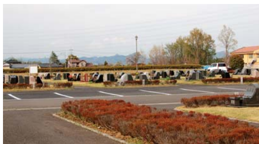
整備された公園墓地