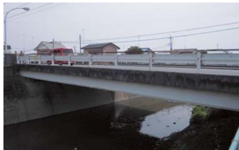
安全性確保のため

Q 橋りよう維持事業の町道に架かる橋りよう維持補修工事費5721万円は、どこの橋の工事ですか。 A 詳細設計に基づき、鹿島橋の橋りよう工事の予定です。 Q 生活圏の整備・側溝およびゲリラ豪雨時の道路冠水箇所の改修工事を早期に検討してください。 A 早期に検討いたします。