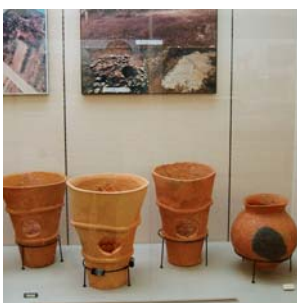
郷土の誇り埋蔵文化財