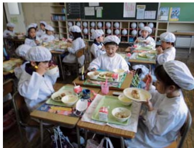
未来を担う子どもたちに支援を

①「特別老人ホーム」の建設と入所待機者解消策を ②ゆとり教育による学力低下の改善策を ③いじめ防止対策を ④いじめ問題の解決に真剣に取り組めます ⑤学校給食費の補助を多くしていきたいと考えます ⑥負担軽減措置を準備しております ⑦道路整備と公共下水道の整備を1日も早く進めます ⑧防犯・交通安全・災害等しっかりと取り組んでいきます ⑨1世帯あたり、年平均7800円減額します