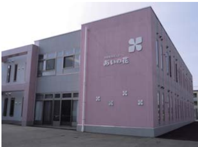
高齢者にやさしいまちづくりを

今後は先進地をしつかり と視察・調査・研究をし、 町独自の定着に向け、介護 職員の方々が働きやすく、 また、住みやすい町を目指 していきます。