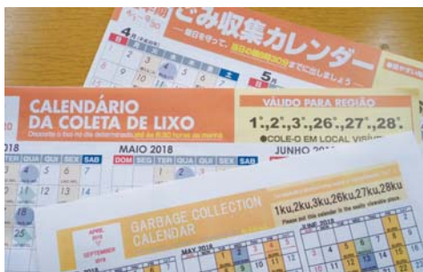
多言語のごみ収集カレンダー