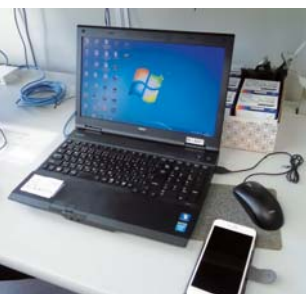
新時代へのツール

A アプリなどスマートフォンやパソコンで見られるツールを検討しています。老若男女誰もがわかりやすい広報を引き続き検討していきます。