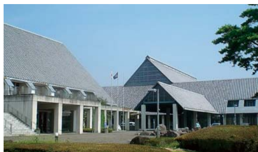
駐車場の早期整備を