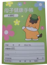
願う成長をかなやかな母子健康手帳