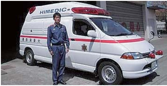
町民の命を守る高規格救急自動車

A 平成26年度に更新した城之内出張所の救急車と同様であり、最新の設備を備えた高規格救急自動車です。