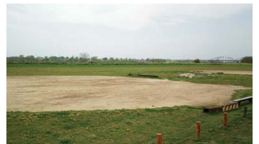
改修予定のソフトボール場

A 台風の影響により、ソフトボール場が冠水したため現在利用ができなくなっています。改修スケジュールとして、5〜6月に工事を予定しています。