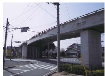
安全確保のために