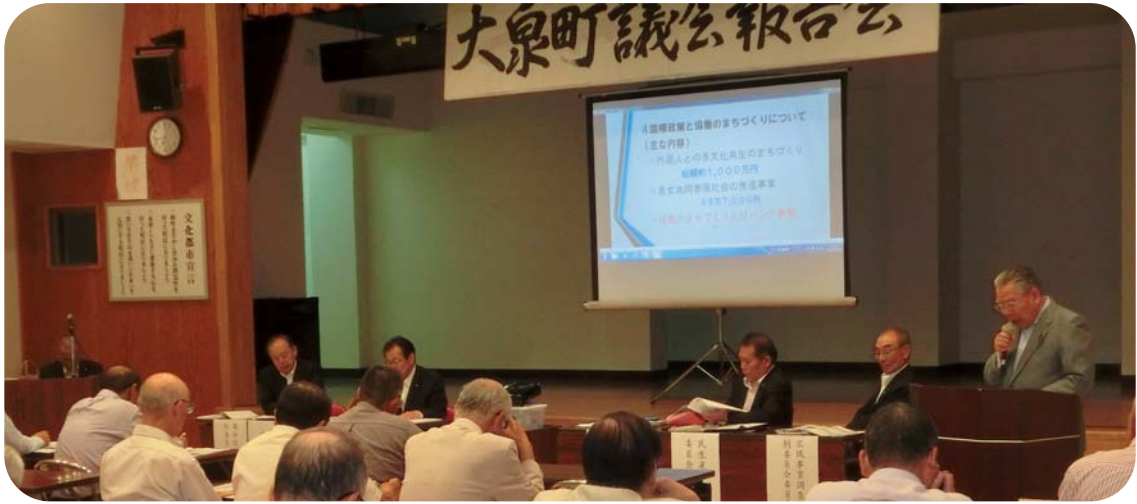
前回の議会報告会の様子