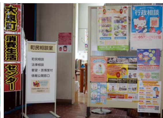
大泉町消費生活センター