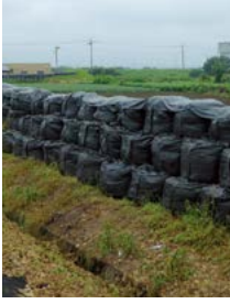
八瀬川越水対策事業

昨年の令和元年東日本台風による寄木戸地区の洪水被害は、七ヶ村用水路の溢水 いっすい よりも、太田市八瀬川の越水 いっすい が本町に流入したことがはるかに大きな要因だったと考えます。こうした事態を受けて、本町でも、太田市や県などと連携して、迅速に対応されているものと思いますが、太田市の八瀬川越水箇所 いっすい に、ごく最近、土のうによる暫定