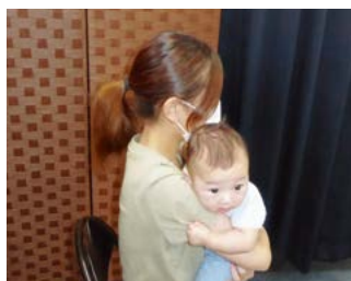
新型コロナウイルスに 負けない支援を

(1) 国民健康保険税は、現在、保険料(税)の減免を行うための規則の整備等を実施しています。後期高齢者医療制度は、群馬県後期高齢者医療広域連合が、保険料の減免を実施するための要綱を制定しています。介護保険料については、保険料の減免ができるよう介護保険条例に規定しているところです。 (2) 今後も、健全財政を堅持しながら、将来できるように検討します。